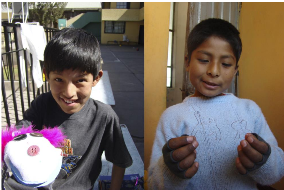
Fig. 6 y 7. Taller de títeres, 2006. / Taller de alambre, 2006. Sumac Wasi de Santo Tomás de Aquino. Arequipa (Perú). Ong de referencia: Setem Andalucía. Ong de acogida: Circa.

Disponen de servicio psicológico y sanitario, este trabajo es realizado por voluntarios que reciben el apoyo de cooperantes extranjeros. En el mes de estancia realicé con los niños actividades creativas, se hicieron títeres de calcetín, pulseras y colgantes de silueta con alambre. Los talleres eran al aire libre y lo que les divertía era el aspecto escénico de la actividad. Los títeres son una actividad universal que funciona bien en Educación Artística. Por las tardes nos ocupábamos de que los niños realizaran sus tareas y preparábamos las clases que impartimos en diferentes colegios.