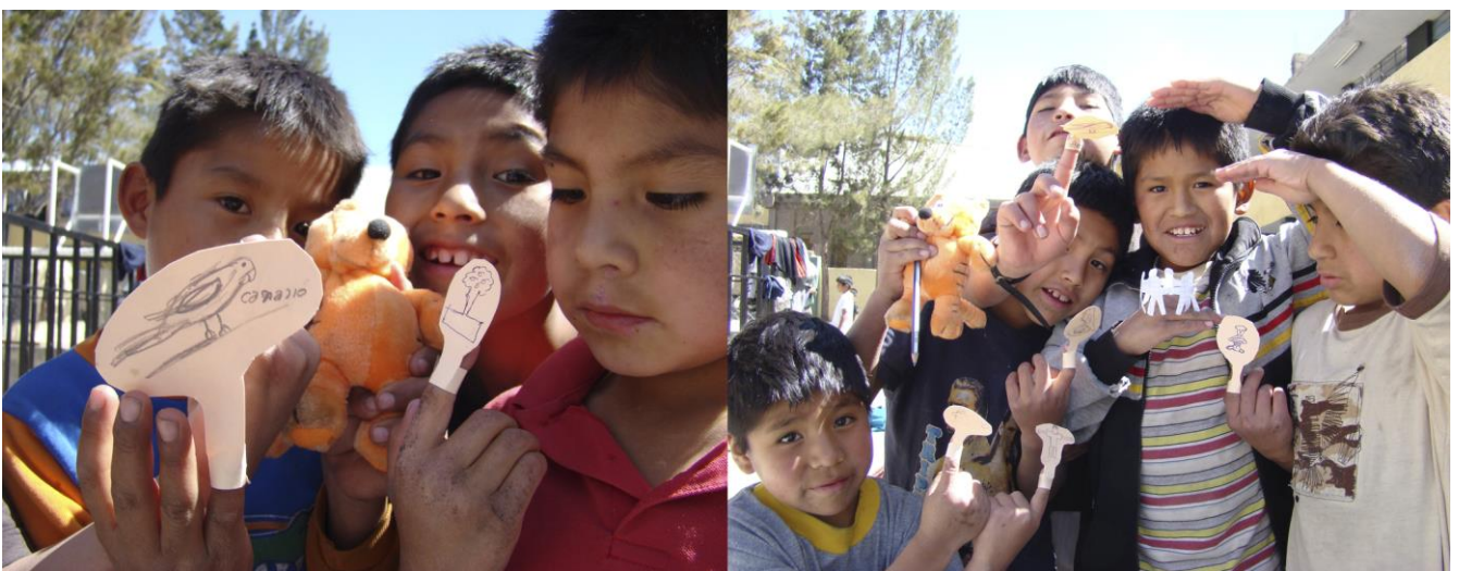
Fig. 4 y 5. Talleres de títeres de dedo, 2006. Sumac Wasi de Santo Tomás de Aquino. Arequipa (Perú). Ong de referencia: Setem Andalucía. Ong de acogida: Circa.

Sumac Wasi es un término quechua que significa " Casa Bonita " y son residencias donde se alberga a recién nacidos, niños, niñas y jóvenes desprotegidos. Son orfanatos pertenecientes a CIRCA que son un total de ocho, en estos centros se les proporciona alimento, educación, ropa y una orientación en valores. Se fomenta la autodisciplina en su formación para forjar su personalidad.