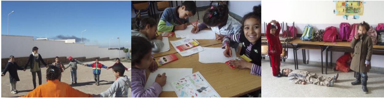
Fig.1, 2 y 3. Aprendiendo las partes del cuerpo con canciones. / Vocabulario con dibujos. / Verbos de acción con expresión corporal. Complejo socio-educativo de Sala Al Jadida (Marruecos), 2012. Org de referencia: Catalunya Voluntaria. Org de acogida: FCC

La otra actividad fue realizada en el 2006 con unos talleres educativos realizados en el Sumac Wasi de Arequipa (Perú), la ONG era Setem Andalucía y la de acogida CIRCA y se realizaron en el orfanato de Santo Tomás de Aquino. Las actividades principalmente eran en referencia a teatro, actividades creativas y relacionadas con el inglés.