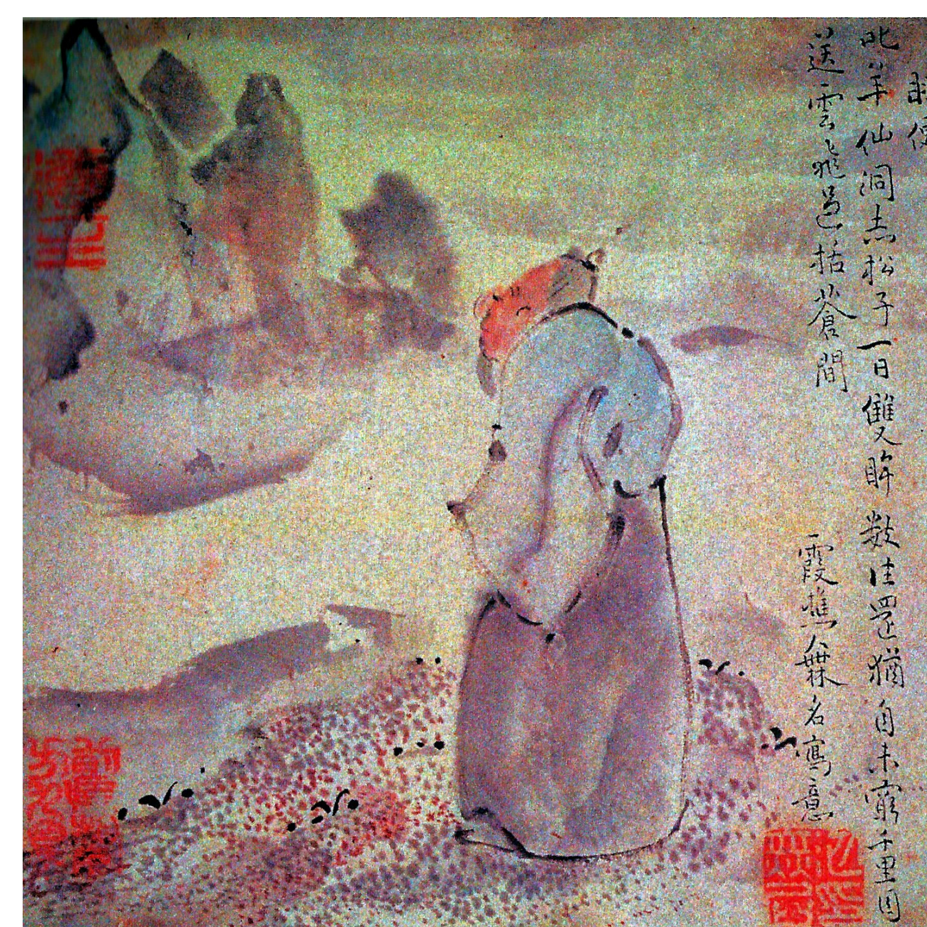
Yosa Buson (1716-1784)