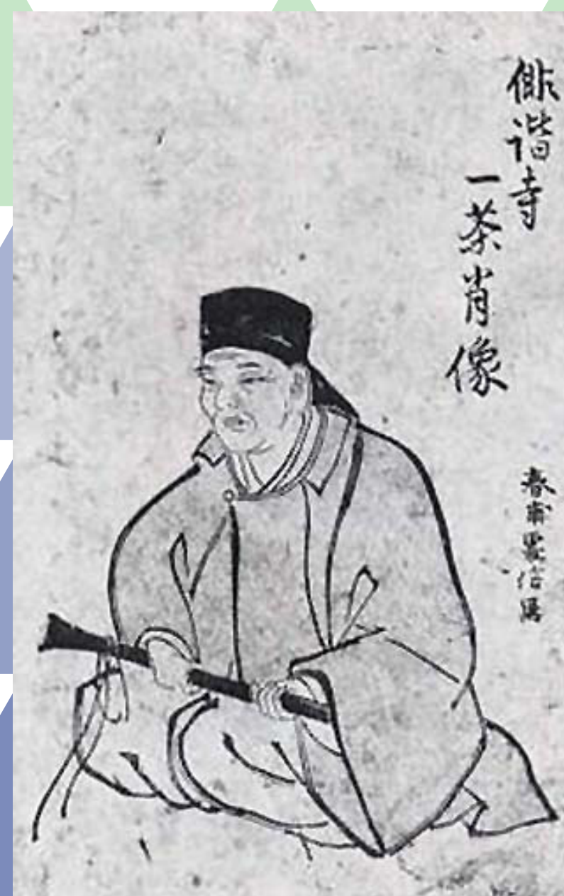
Kobayashi Issa (1763-1827)