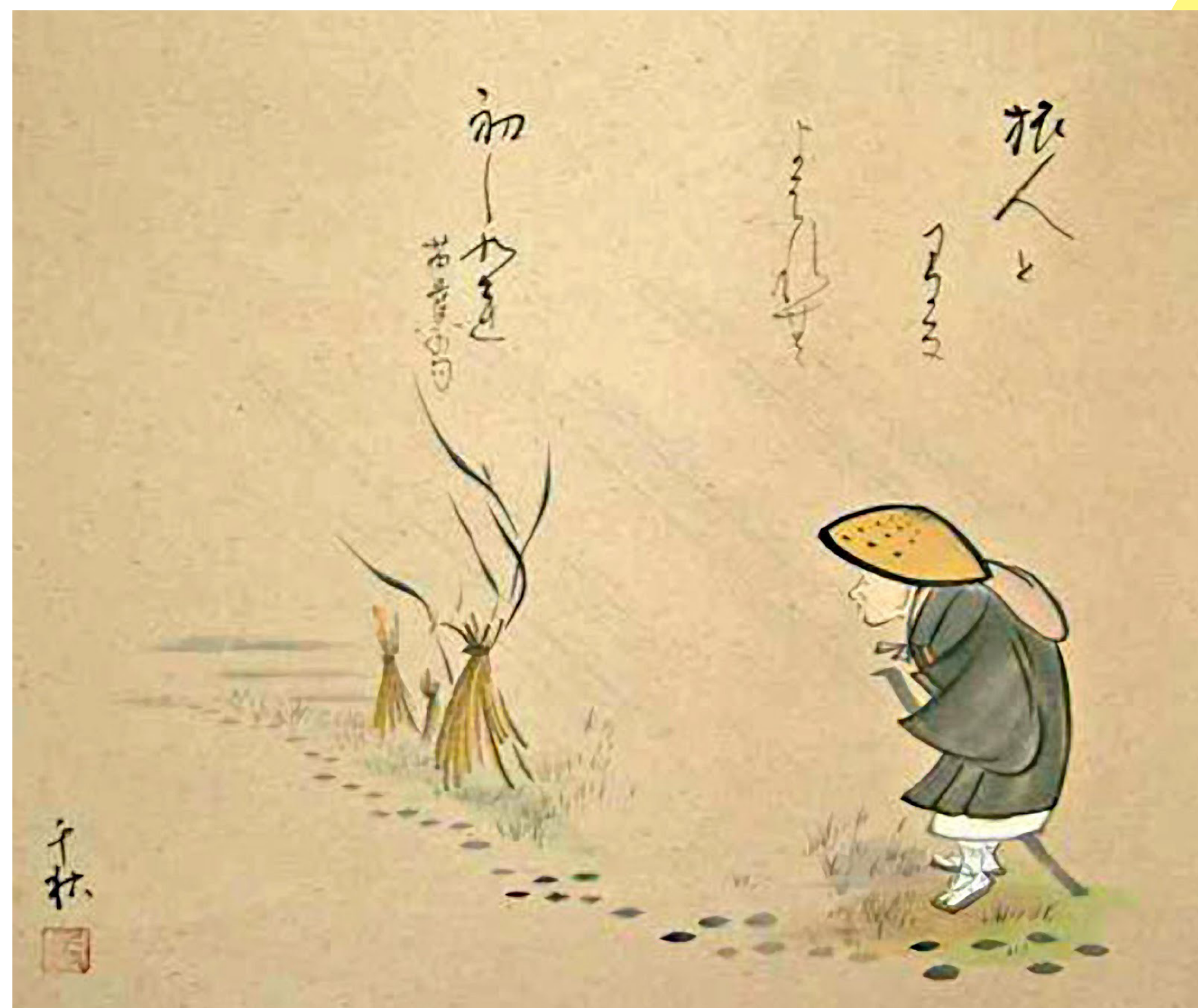
Basho (1644 – 1694). "Basho en la estrecha carretera al interior".