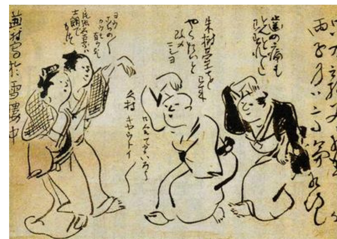
De derecha a izquierda aparecen:

Yosa Buson (1716-1784) Inoue Shiro (1742-1812) Kumura Kyotai (1732-1872)