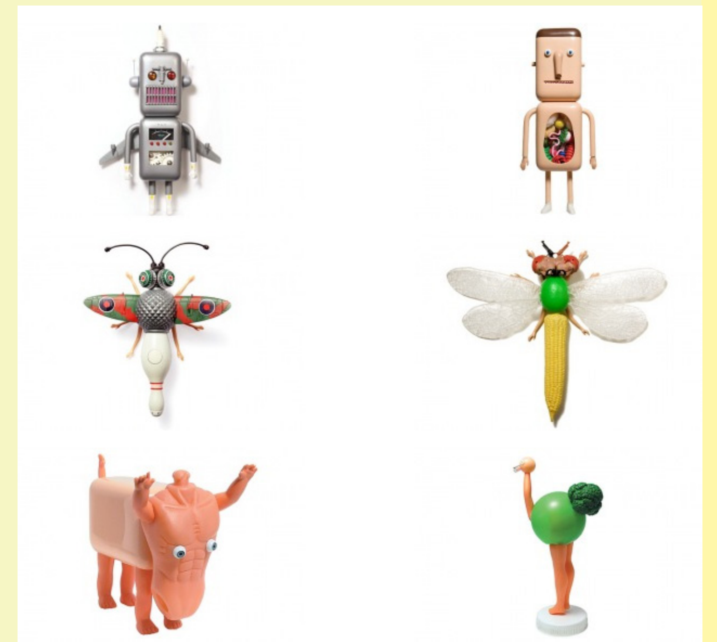
Imagen del blog: Patricio Rodríguez Gonzalez. Artista: Sang Won Sung

Es una colección de páginas web que pueden ser editadas fácilmente y están abiertas pero se pueden configurar para proporcionar un acceso selectivo o bien ser totalmente cerradas. Dispone de una sencilla base de datos en línea donde cada página es editada fácilmente por cualquier usuario con un navegador web y no se precisa de un software específico. Son almacenes de conocimiento compartido que crece y se enriquece con nuevas aportaciones.