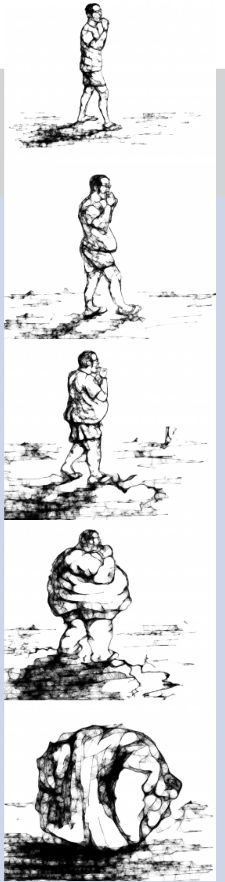
Imagen del blog. Autor: Patricio Rodríguez Gonzalez.

La Web 2.0 ofrece un gran número de herramientas y aplicaciones que los profesores pueden utilizar para crear entornos virtuales para el aprendizaje formal. También se pueden crear espacios para el aprendizaje informal Personal Learning Environment. Los blogs y los wikis actuarían de eje central donde se pueden añadir elementos de otros servicios como: Youtube (vídeos), Flickr (imágenes), Odeo (podcast), Delicious (marcadores).